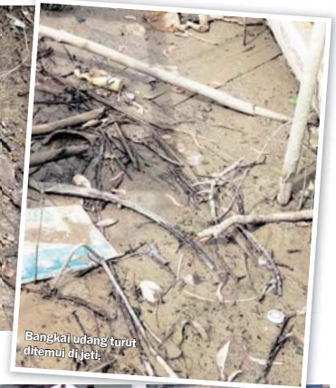
Bangkai udang turut ditemui di jeti.

berkaitan dapat memantau dan menyasiat faktor berlakunya kejadian berkenaan.