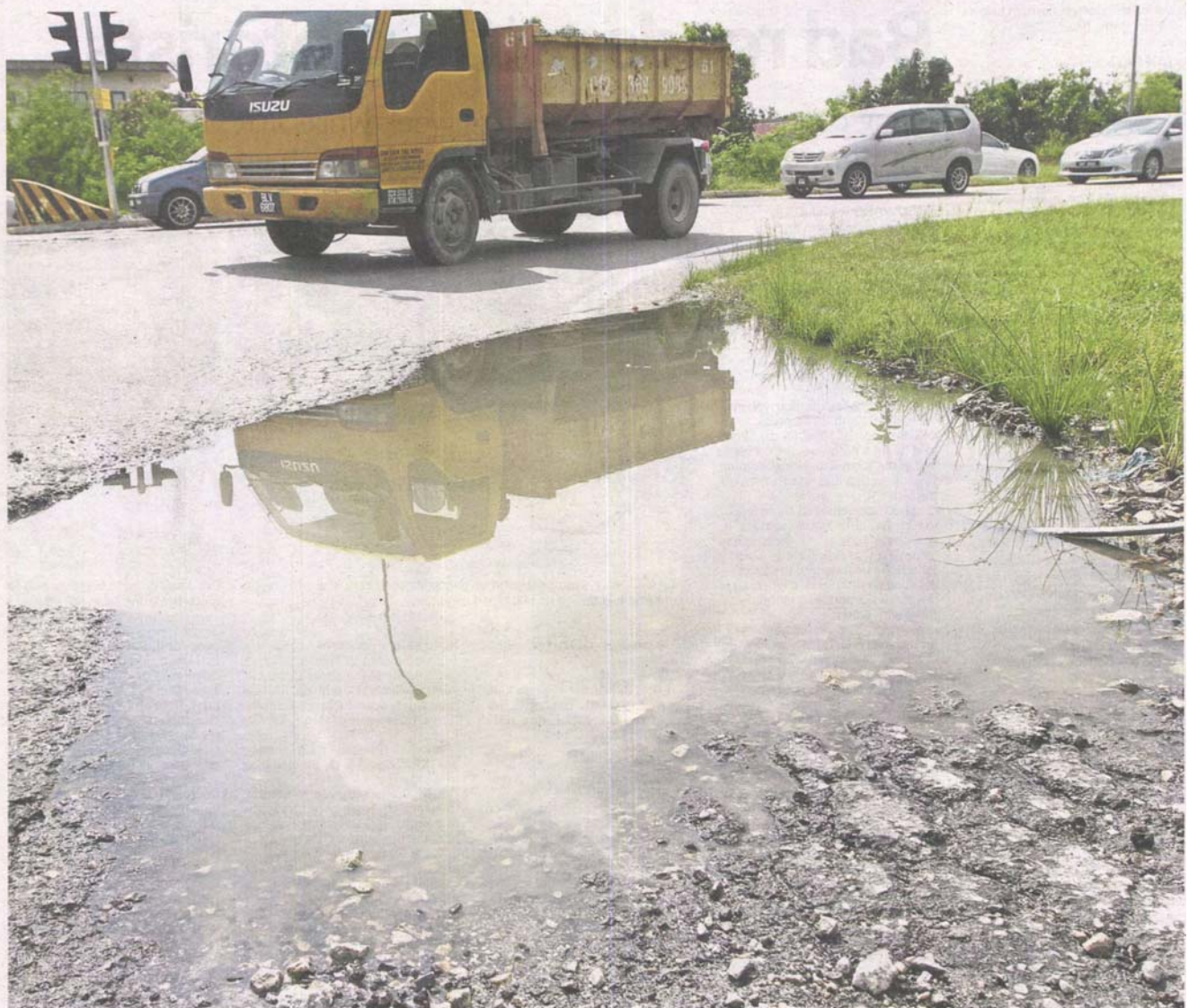
Giant hazard: This large pothole at the intersection of Jalan Raja Nong and Jalan Seruling 59 in Klang poses danger to motorcyclists.

Klang motorists want Public Works Department to improve road conditions as they find it challenging to drive through areas riddled with potholes. >2&3