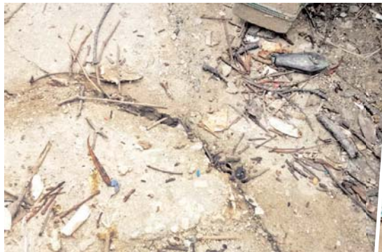
Bangkai ikan ditemui terdampar berhampiran Jeti Kampung Teluk Nipah.