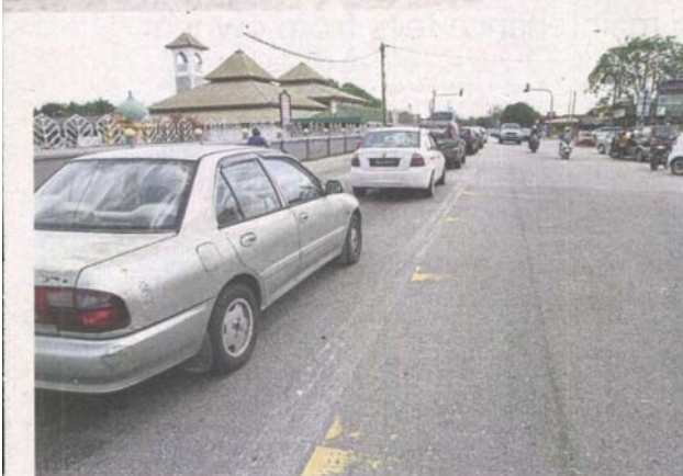
Road lines have faded along the road just outside Masjid Dato Dagang.