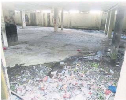
■店寓底楼泊车场堆满垃圾，已荒废。