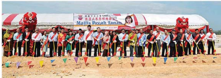
25名热心人士及嘉宾集体一起为培智小学主持动土礼。