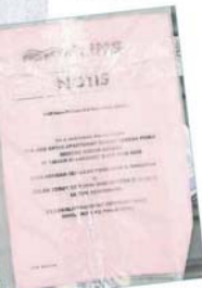
↑联合管理机构在店外贴通知信，要求业者主动联络管理层。