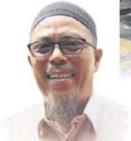
■尤斯里：店寓90%都是外劳居民。