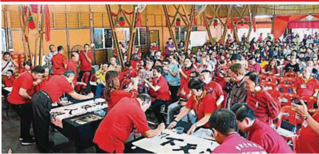
300人聚集在吉胆乡村议会礼堂，观看书法家们当众挥毫写春联，浓浓春意飘岛上。

Provided for client's internal research purposes only. May not be further copied, distributed, sold or published in any form without the prior consent of the copyright owner.