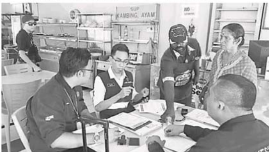
卫生局人员到一间咖啡店检举时，发现该店的卫生条件不达标。