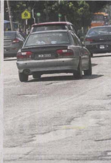
A deep depression on Jalan Pokok Sakat in Taman Setia can cause a nasty accident if not repaired. (Right) The constant patching works done on the road outside SK Telok Menegon along Jalan Kota Raja have left the surface uneven.