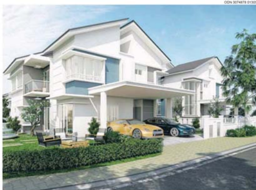
莎阿南第17区的10 Residensi项目的买家，可享受有多种超值优惠。

她透露，希望透过这次的「PKNS Mega Bonanza」促销活动，为该机构的旗下产业取得亮眼