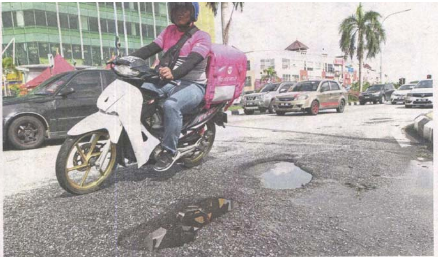
A damaged road at the bend of Persiaran Pegaga in Taman Bayu Perdana.