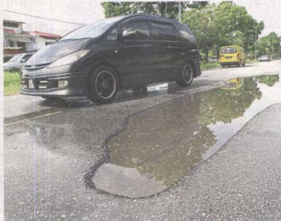
A large pothole along Jalan Gambus in Taman Desawan, Klang. Motorists have to be careful to avoid hitting these potholes.