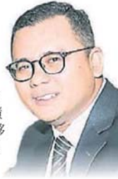
■阿米鲁丁：依表现奖励官员。(档案照)

能力达标甚至超越，而获得更高的花红奖励。” 他指出，若雪州所有公务员都能够达到设定的绩效指标，相信州政府也能够发出2个月以上的花红给大家。 出席者还有雪州秘书拿督莫哈末阿敏、雪州议长黄瑞林。