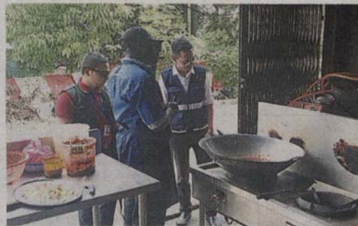
■ 衛生條件欠佳，下令關閉。這間由外勞管理的餐館

繳交每月分別50及100令吉管理費，至今拖欠共15萬令吉管理費，另外366間寓所里，拒絕繳交每月30令吉管理費多達336住戶，拖欠至少25萬令吉管理費。