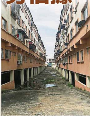
這條兩棟店寓之間的地下停車場通道，曾經是一條“垃圾路”，雖然目前有清潔工人打掃，仍有外勞亂丟垃圾。