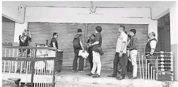
听到风声，外劳食店业者连生意也不做，以免被取缔。