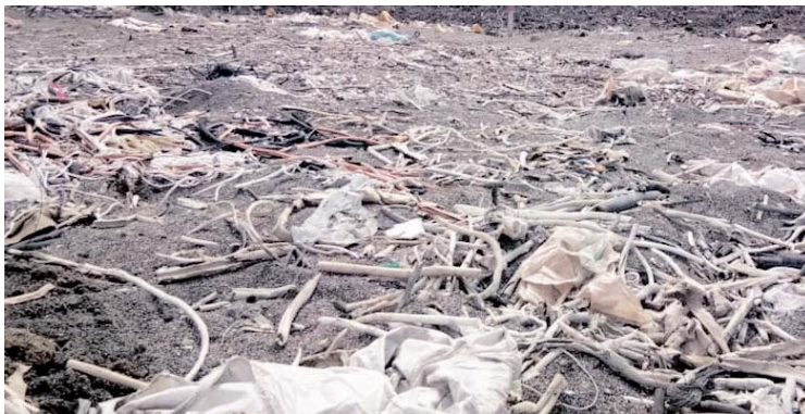
Sisa getah dan sampah domestik yang dibuang di kawasan berhampiran.