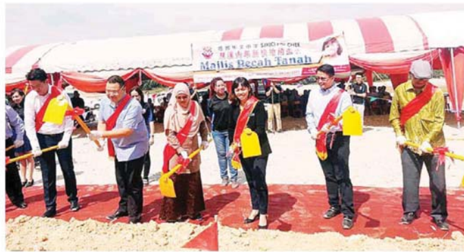
张念群（右 3）为迁校的培智小学主持动土礼。左 1 起为黄思敏，林桂亿和莎米，右 1 至 2 为戴毓赋与刘国森。

（双溪大年 29 日讯）教育部副部长张念群强调，1996 年教育法令第 29A 条文早就存在，强制家长让孩子接受小学教育，目前政府研究将强制教育的年限延后至 11 年及 12 年，旨在对付没有责任心的父母，希望能起阻吓作用。