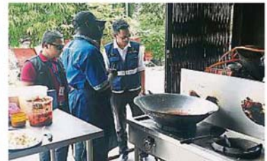
衛生組官員發現外勞管理的餐館，廚房衛生條件欠佳，食物管理不當，被令關閉。