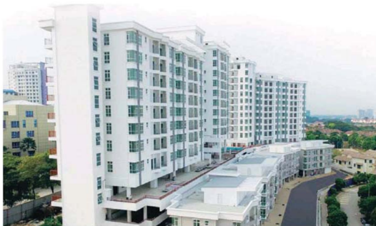
凡购买位于莎阿南第7区Opal Residensi的买家，可获得价值3万令吉的电子商品优惠券及享有1万5000令吉的「文件奖励」。