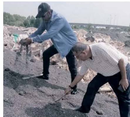
Wakil JAS Selangor turun padang memeriksa kawasan terabit.