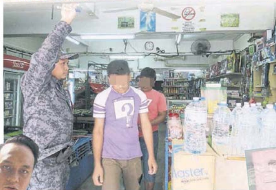
一移民局执法员带走两名疑没有证件的外劳。