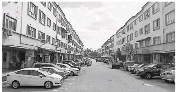
蕉赖百马花园店寓沦为“外劳村”。

卫生局人员检举一间由外劳看管的咖啡店时，发现该店的环境卫生一团糟，食物残渣也直接排入沟内。为此，卫生局人员谕令马上关店一星期以进行清理工作，同时，该店的员工也没注射疫苗。