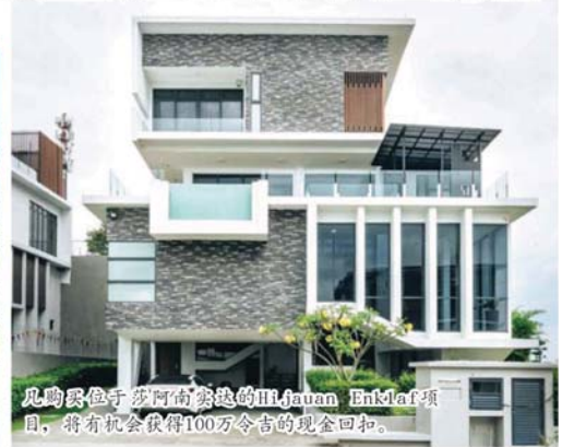
凡购买位于莎阿南实达的Hijauan Enklaf项目，将有机会获得100万令吉的现金回扣。

销售额及激起市场「买屋风气」。她强调，上述折扣优惠旨在让每个大马人都会有机会可以获得属于自己的家。