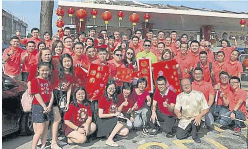
巴生新镇州选区特别通过现场挥毫春联，以派发给民众，作为新年祝福。