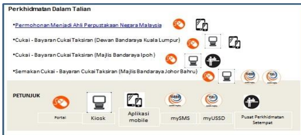
Rajah 4: Ikon Perkhidmatan Pelbagai Saluran