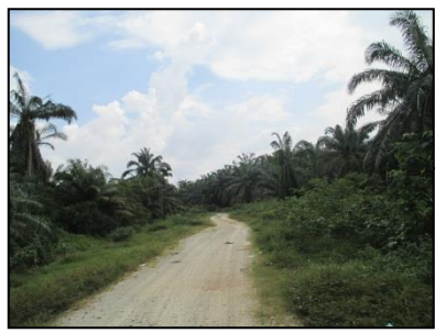
Sempadan utara – simpanan jalan

PERMOHONAN KEBENARAN MERANCANG MENGIKUT SEKSYEN 21 AKTA 172 BAGI TUJUAN PENYERAHAN BALIK DAN PEMBERIMILIKAN SEMULA DI BAWAH SEKSYEN 204B, KANUN TANAH NEGARA DI ATAS LOT 1234 (PM 5678) SELUAS 2.111 HEKTAR, MUKIM TELOK PANGLIMA GARANG, DAERAH KUALA LANGAT, SELANGOR DARUL EHSAN UNTUK TETUAN INTAN BAIDURI SDN BHD.