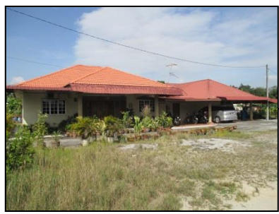
Sempadan barat – Lot 314; rumah kediaman sesebuah