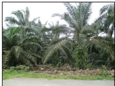
Keadaan semasa tanah yang dipohon – tanaman kelapa sawit