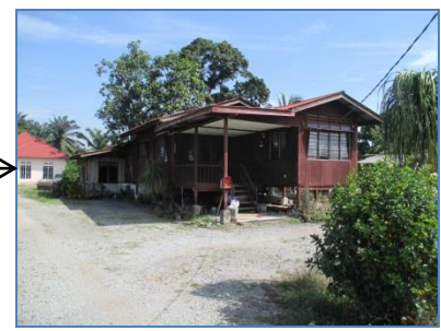
Sempadan selatan – Lot 2642; rumah kediaman dan pertanian