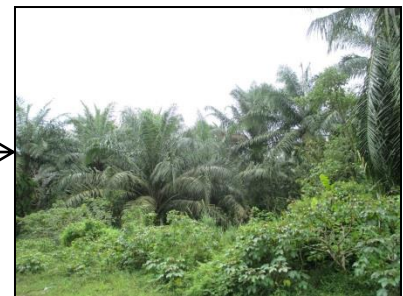
Sempadan timur – Lot 15800; kelapa sawit