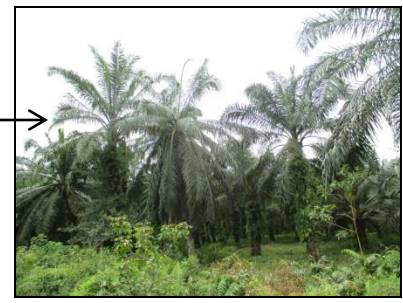
Keadaan semasa tanah yang dipohon – tanaman kelapa sawit