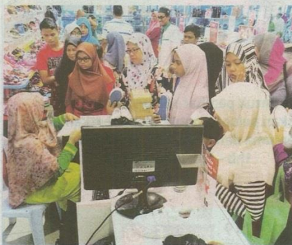
Sebahagian penerima bersama penjaga masing-masing pada Program Senyum ke Sekolah, semalam.

"Jadi...saya terpaksa buat pengumuman setiap hari Jumaat, sebelum khutbah untuk mohon jasa baik masyarakat jangan buang sampah di kawasan yang tak sepatutnya, tetapi masih juga berlaku longgokan sampah haram," katanya.