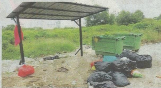
Antara lokasi longgokan sampah haram di sebuah kampung tradisi.

Mohamad Zain berkata, sebanyak 175 unit tong