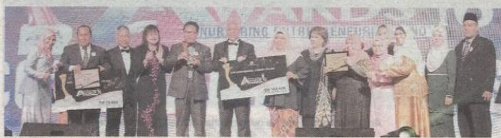
Gazari (tjma, kiri) mewakili Kolej Komuniti Kuala Langat menerima anugerah The Most Entrepreneurial Community College 2016 menerusi MEA dengan menewaskan dua finalis komuniti yang lain.

Menurutnya, dengan menyahut kempen #YouCanDont daripada Kementerian Komunikasi dan Multimedia, kolej itu juga merupakan Pusat latihan Teknik dan Vokasional (TVEI) bagi program e-Rezeki dan e-Ushawan yang mana masyarakat diberi pendedahan mengenai ilmu dan kaedah keusahawanan digital dan seterusnya meningkatkan pendapatan komuniti setempat.